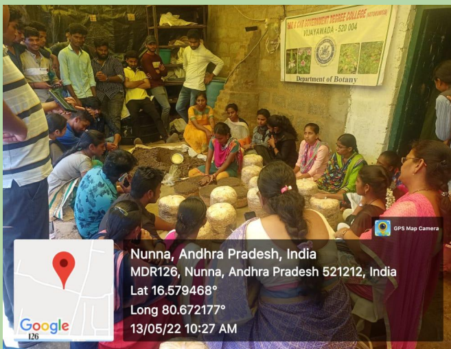
Nunna, Andhra Pradesh, India MDR126, Nunna, Andhra Pradesh 521212, India Lat 16.579468° Long 80.672177° 13/05/22 10:27 AM

V Day training dated 13.5.2022 : On the fifth day of training students got the training on preparation of mushroom cases, storage methods , Marketing methods and financial process of mushroom culture industry.