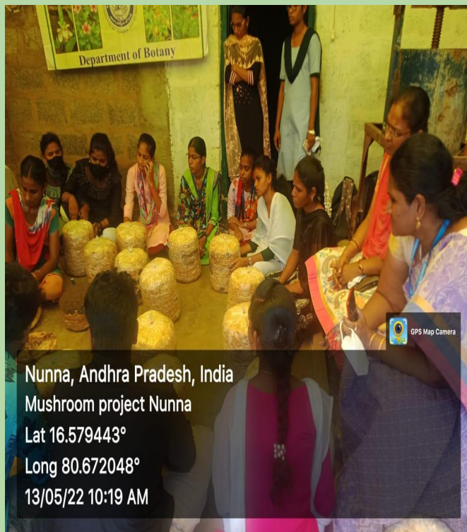
Nunna, Andhra Pradesh, India Mushroom project Nunna Lat 16.579443° Long 80.672048° 13/05/22 10:19 AM