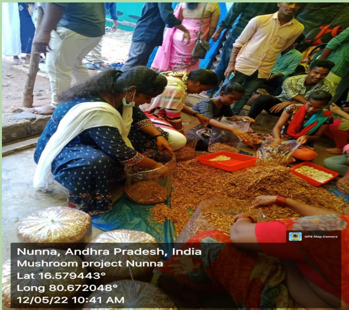
Nunna, Andhra Pradesh, India Mushroom project Nunna Lat 16.579443° Long 80.672048° 12/05/22 10:41 AM

preparation of spawn, filling up of polythene covers with grass and spawn , drying casing etc