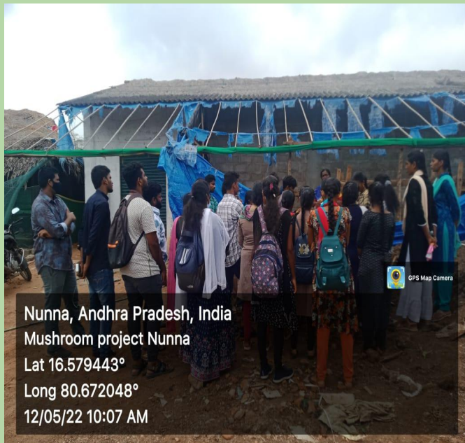
Nunna, Andhra Pradesh, India Mushroom project Nunna Lat 16.579443° Long 80.672048° 12/05/22 10:07 AM

V Day training dated 13.5.2022 : On the fifth day of training students got the training on preparation of mushroom cases, storage methods , Marketing methods and financial process of mushroom culture industry.